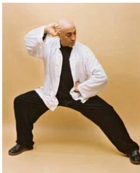
WTKA Italia Karate